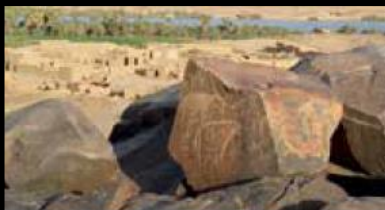
Głaz z przedstawieniami bydła długorogiego i postaci ludzkiej. IV-II tys. p.n.e. Gamamiya, Sudan.