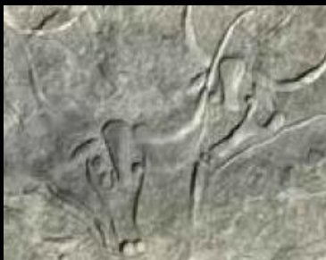
Tzw. Płaczące krowy z Terrarart. V-II tys. pn.e. Tassili-n-Ajjer, Algieria.

bo tak należałoby przetłumaczyć nazwę Tassili-n-Ajjer, znajduje się we wschodniej Algierii, tuż przy granicy z Libią. Masyw ten kryje w sobie tysiące malowideł i rytów, które stanowią jeden z największych na świecie i najbardziej niezwykłych kompleksów ze sztuką naskalną. Najstarsze petroglify mogą pochodzić nawet z X tysiąclecia p.n.e., a ich twórcami byli zapewne łowcy i zbieracze zamieszkujący obszary wielkiej sawanny, którą dziś nazywamy Saharą. Pomiędzy VII a V tysiącleciem p.n.e. powstały jedne z najbardziej intrygujących malowideł przedstawiających m.in. postacie o okrągłych głowach, które francuski badacz Henri Lhote nazwał w swoim czasie Marsjanami. Tzw. Wielcy Bogowie to inne charakterystyczne figury, którymi przyozdobiono skalne schroniska Tassili. Technika malarska oraz treść przedstawianych obrazów czynią ze Stylu Okrągłych Głównie najbardziej rozpoznawalny element sztuki naskalnej algierskiego płaskowyżu.