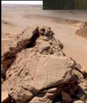
Głaz z prahistorycznymi wizerunkami kobiet na jednym ze wzgórz oazy Dachla. VIII-IV tys. p.n.e. Egipt.