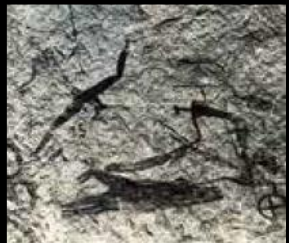
. Pełne ruchu przedstawienie bojowego rydwanu zaprzężonego w konia w dolinie Messiradiene. II-I tys. p.n.e. Tassili-n-Ajjer, Algieria

V tysiąclecie p.n.e. to okres przemian gospodarczych w rejonie Sahary Centralnej. Zbieractwo i łowiectwo zostało stopniowo wyparte przez pasterstwo, a zjawisko to znalazło odzwierciedlenie w sztuce naskalnej. Bydło stało się najczęściej przedstawianym motywem malowideł i petroglifów, człowiek zaś portretowany był przeważnie w jego towarzystwie. Niewykluczone jednak, iż sceny pasterskie, które często interpretuje się jako sceny życia codziennego, posiadały głębsze znaczenie dla ich twórców i nawiązywały do wierzeń.