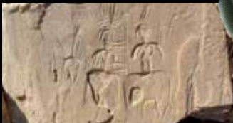
Neolityczne wizerunki kobiet. Niewykluczone, że postacie te związane były z symboliką płodności. VIII-IV tys. p.n.e. Oaza Dachla, Egipt.