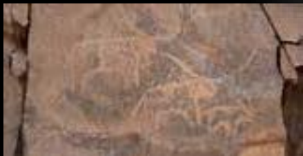
Ryty naskalne w rejonie IV katarakty na Nilu przedstawiające wielbłądy. Brak patyny na petroglifach sugeruje relatywnie niedawną datę powstania. Sudan.