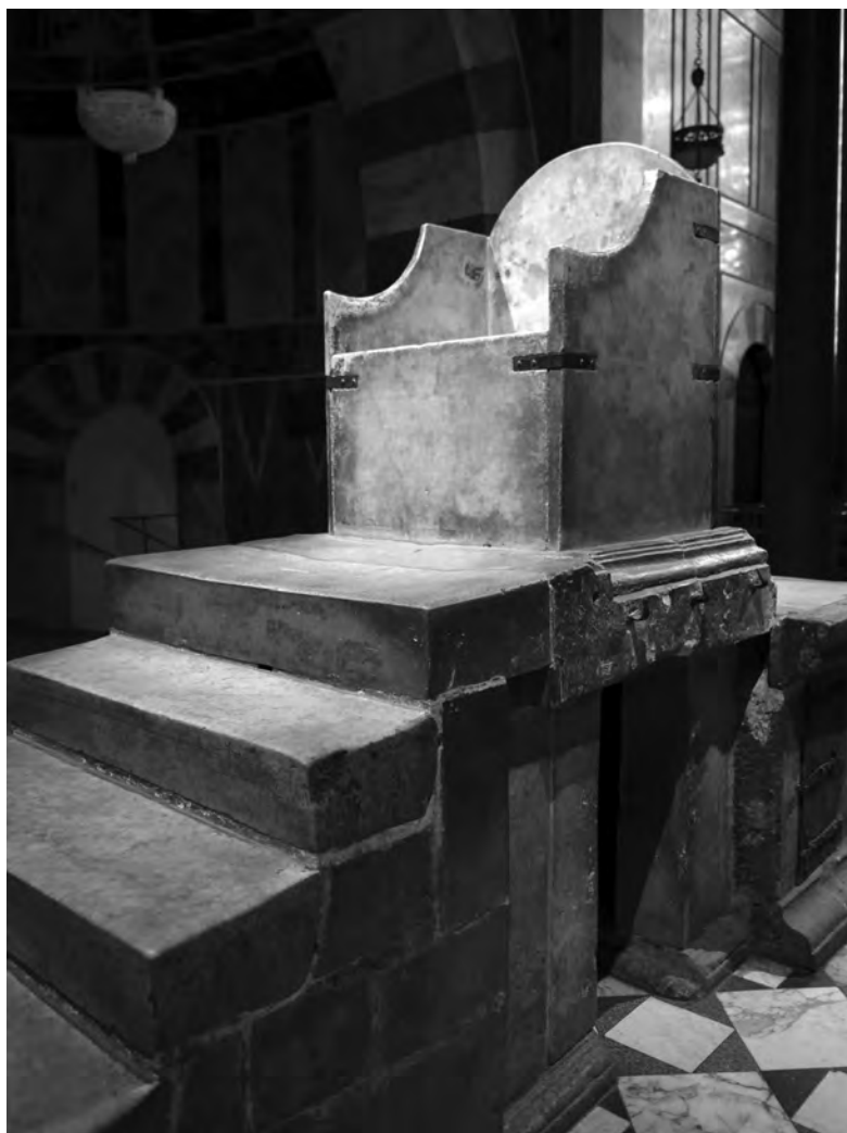
Tron cesarski z kaplicy pałacowej w katedrze pw. Najświętszej Marii Panny w Akwizgranie (Aachen, Niemcy).