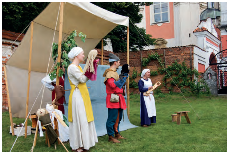
Spektakl Teatru Jarmarcznego Civies Glogoviae 1253.