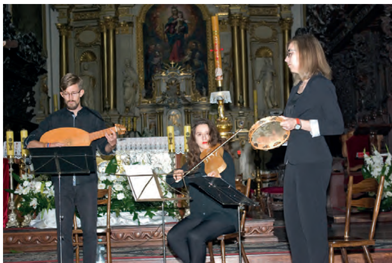
Koncert zespołu „Lúthien Consort”.