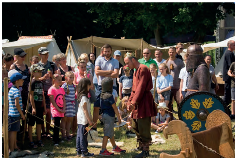
„O królu Kraku” – fragment widowiska dla dzieci.