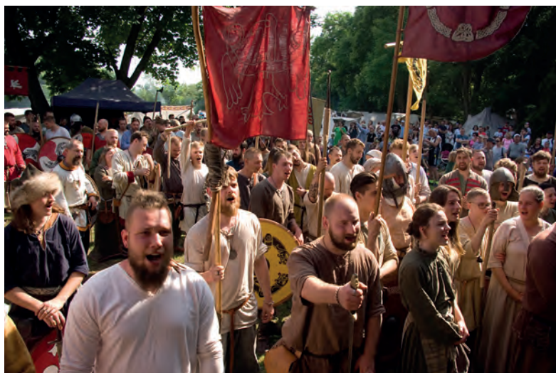
„Ciagnij dalej!” czyli apel o kontynuację Festiwalu.