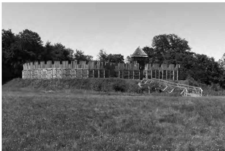
Chotěbuz-Podobora koło Czeskiego Cieszyna (Czechy). Współczesna rekonstrukcja grodu wczesnośredniowiecznego (wg stanu z 2012 roku).

udało się od VI do VII wieku opanować znaczne obszary Europy. Kwestia jest dość złożona, bo przecież Słowianie również walczyli z Awarami. Niewątpliwie jednak od koczowników zaczerpnęli oni wiele rozwiązań militarnych, np. pozorowaną ucieczkę, czy inne zaskakujące manewry swoich oddziałów.