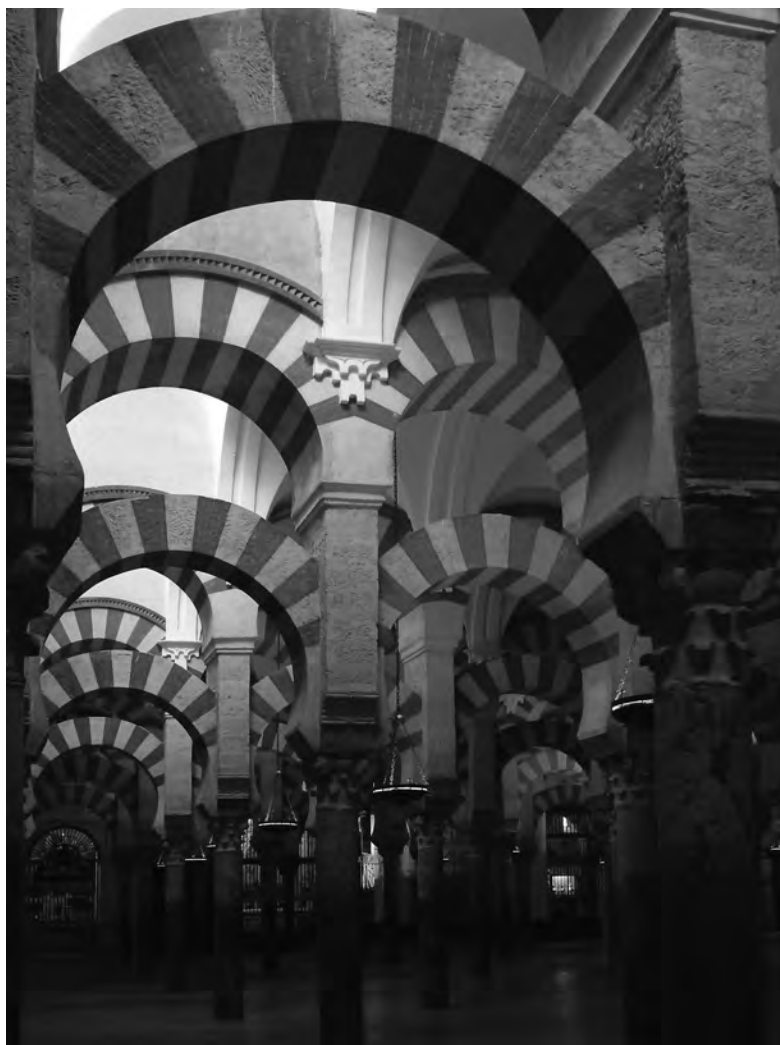
Wnętrze Wielkiego Meczetu (Mezquita) w Kordobie (Hiszpania).