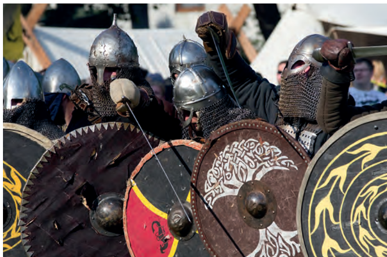
Przed decydującym starciem.