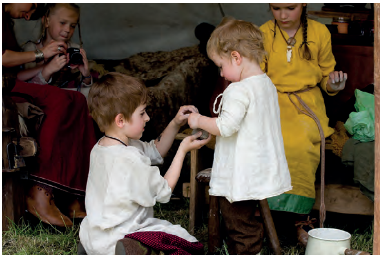
Najmłodszy mieszkańcy obozu słowiańskiego.