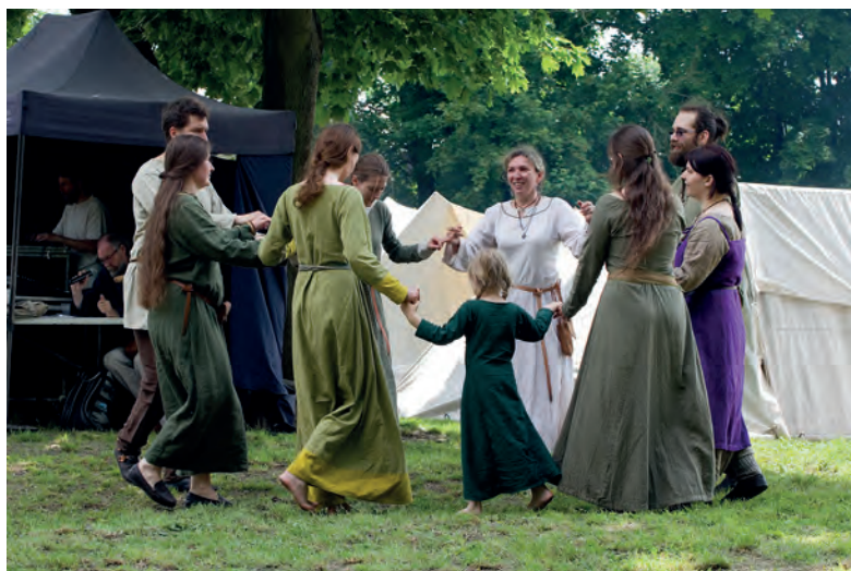
Nauka dawnych tańców.