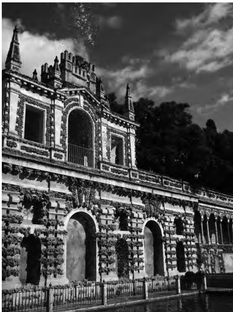
Pozostałości pałacu (alkazar) w Sewilli (Hiszpania) wzniesionego w XI wieku.