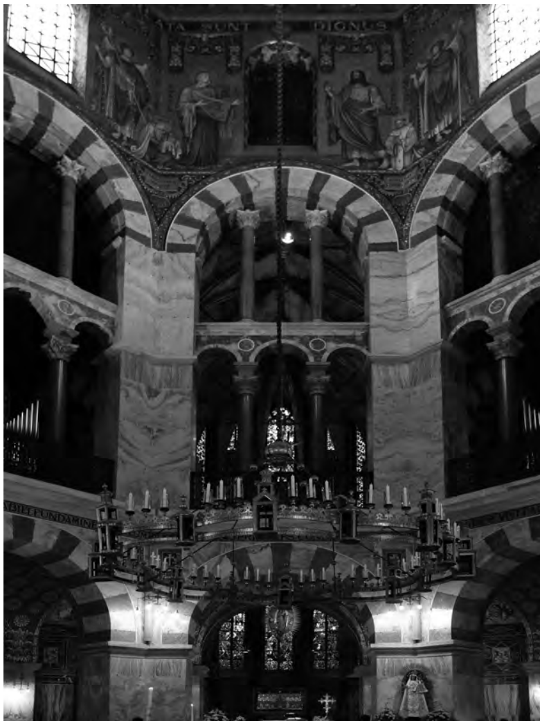
Wnętrze kaplicy pałacowej w Akwizgranie (Aachen, Niemcy).