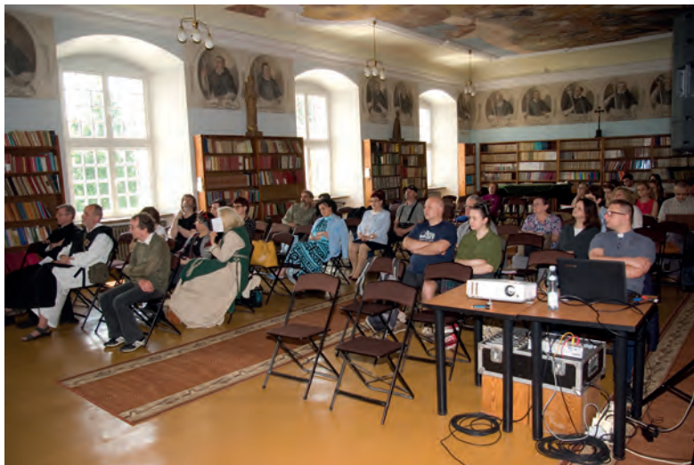
Wykład w sali opackiej.