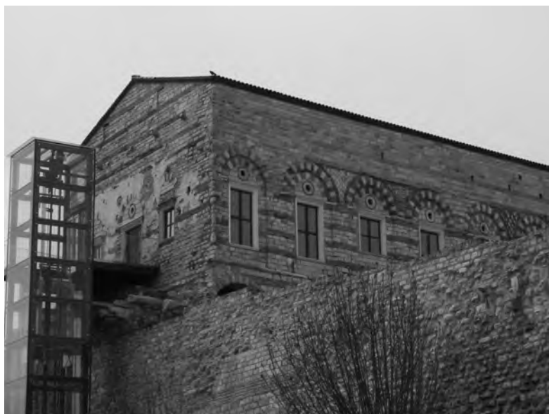
Pozostałości pałacu Porfirogenetów w Konstantynopolu (obecnie: Stambuł, Turcja).

władcy Serbów była w dużej mierze rezultatem dwoistości jego Cesarstwa po podbiciu dużej części zachodnich Bałkanów, znajdujących się dotychczas pod władzą Bizancjum. W związku z tym w południowej części jego państwa utrzymano bizantyńską administrację, wymiar sprawiedliwości, pobór podatków oraz uprzywilejowany status bizantyńskich arystokratów. Nie był to jednak twór trwały, ponieważ wkrótce po śmierci Duszana jego Cesarstwo uległo podziałom pomiędzy jego serbskich współpracowników, w tych okolicznościach zatimizowany świat południowych Słowian niebawem uległ potęgze osmańskiej.