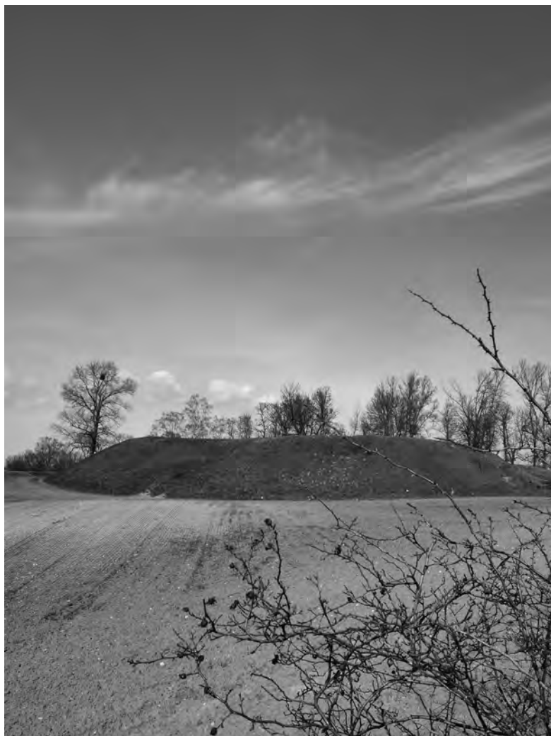
Grodzisko wczesnośredniowieczne w Moraczewie, pow. gnieźnieński.