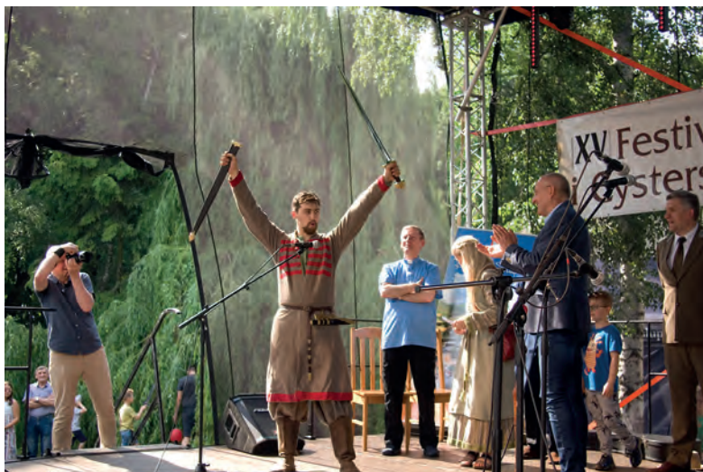
Zwycięzca turnieju o miecz kasztelana łódzkiego.