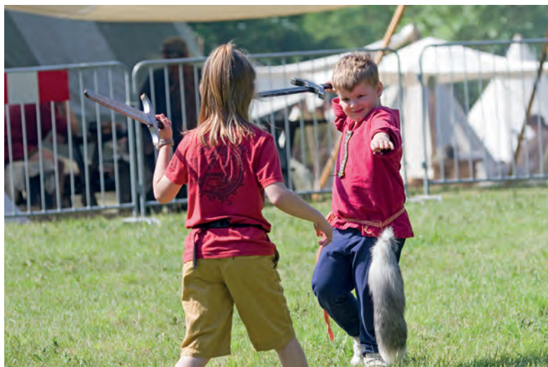
Wojenne ćwiczenie.