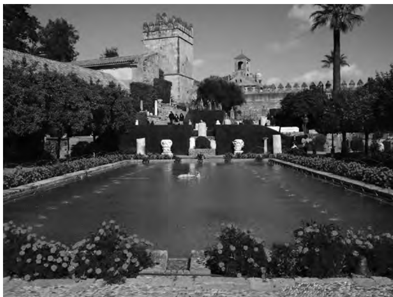
Ogrody pałacu (alkazar) Umajjadów w Kordobie (Hiszpania).