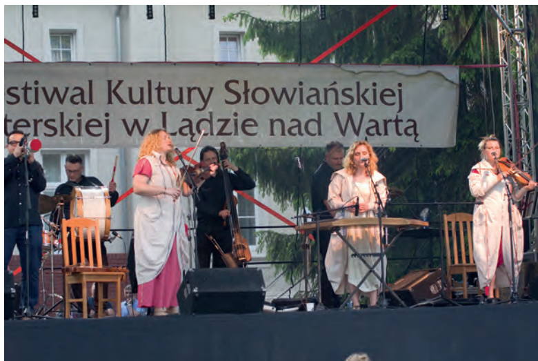
Koncert Kapeli Ze Wsi Warszawa.