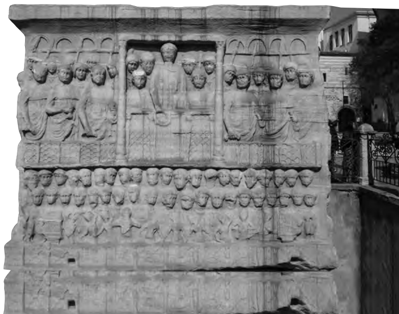
Cokół pod obeliskiem egipskim Totmesa III na terenie hipodromu w Konstantynopolu (obecnie: Stambuł, Turcja).

bliższy niż ustalenia antycznych geografów. Według Pseudo-Cezarego (VI w.), jednego z chrześcijańskich topografów Dunaj był najzimniejszą rzeką świata, zaś żyjący nad jego brzegami Słowianie pożerali piersi karmiących kobiet, rozbiwszy uprzednio ich dzieci o kamienie.