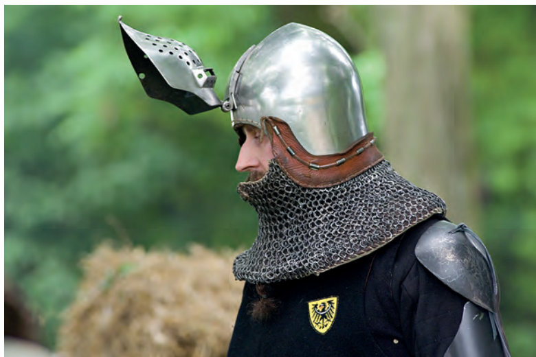
Z podniesioną przyłbicą.