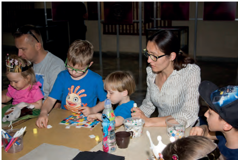
Warsztaty edukacyjne dla dzieci.