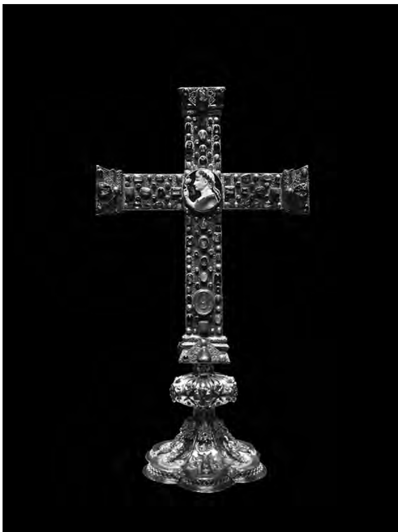
Krzyż Lotara z wmontowaną antyczną gemmą przedstawiającą rzymskiego cesarza Oktawiana Augusta z katedry pw. Najświętszej Marii Panny w Akwizgranie (Aachen, Niemcy).