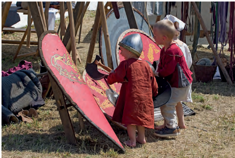
Kandydaci na wojów.