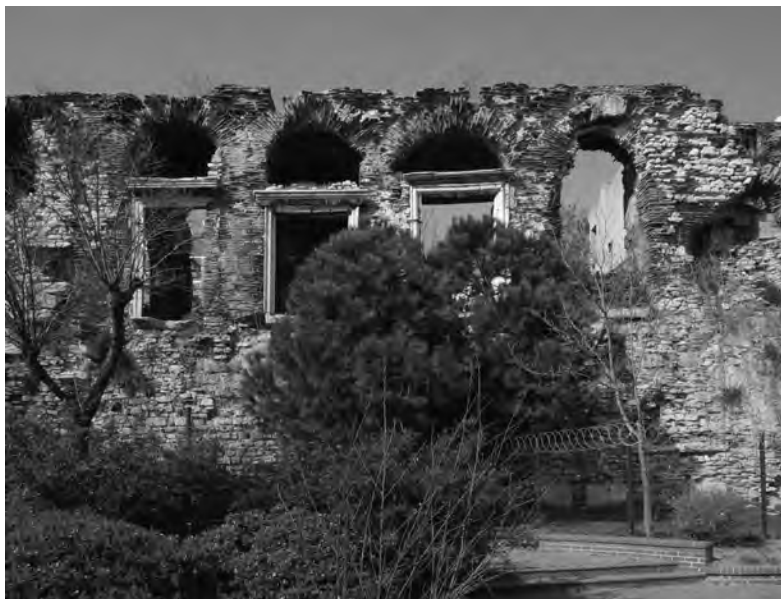
Ruiny wielkiego pałacu cesarskiego w Konstantynopolu (obecnie: Stambuł, Turcja).

zanych niejednokrotnie z ich polityką węgierską i bałkańską), wykorzystanie przezeń danych zamieszczonych w staroruskich latopisach. Pierwszy polski historyk uzyskał doń dostęp, prawdopodobnie dzięki powstałym na Rusi latopisarским zwodom powstałym w latach 1464-1472.