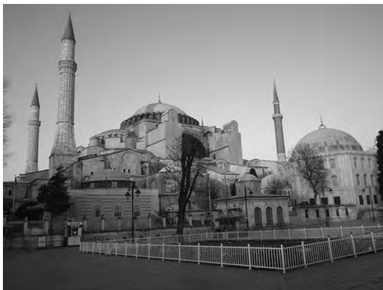
Kościół Hagia Sophia w Konstantynopolu (obecnie: Sztambuł, Turcja).

podróży do Chazarii) wykonał ogromną pracę od podstaw. W jego czasach nie istniał wspólny język Słowian, lecz dziesiątki dialektów plemiennych. Konstantyn urodzony i wychowany w Tesalonice (słów. Sołuń), jednym z najstarszych ośrodków chrześcijaństwa, poznał doskonale języki Słowian zamieszkujących od ponad dwóch wieków najbliższe okolice miasta.