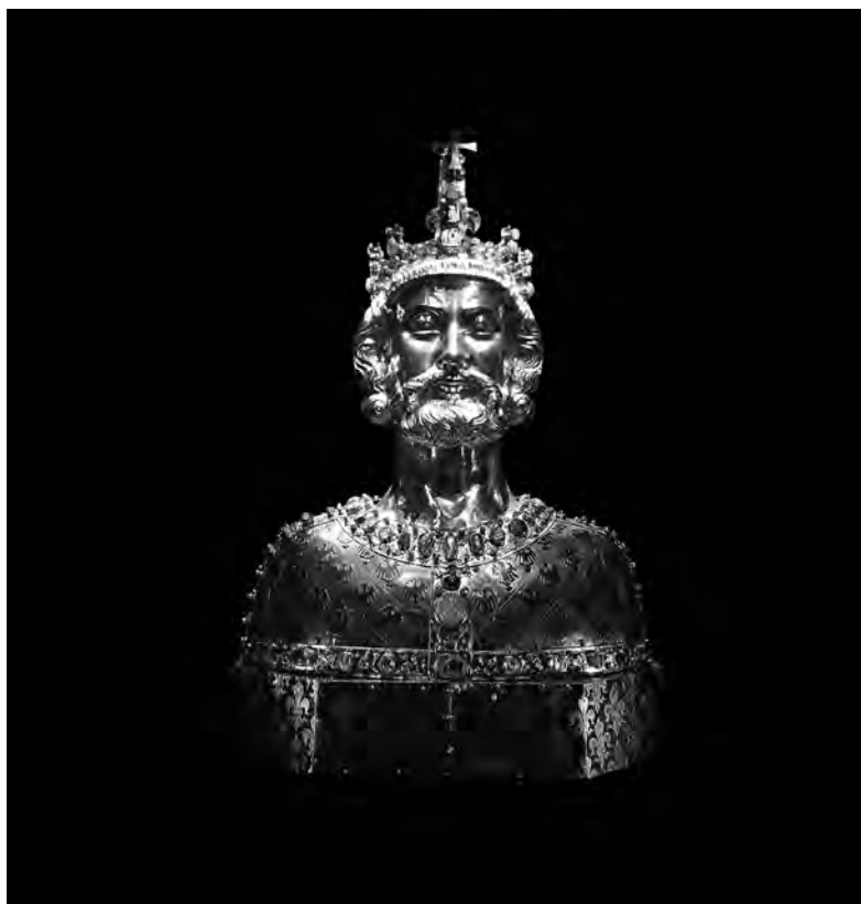
Relikwiarz hermowy Karola Wielkiego z około 1343 roku z katedry pw. Najświętszej Marii Panny w Akwizgranie (Aachen, Niemcy).

Z pewnością przełomem było powtórzenie sakry Pepina w 754 r. w podparyskim kościele Saint Denis przy okazji wizyty papieża Stefana II na dworze karolińskim. Wówczas to papież starał się o wsparcie Karolingów w walce z gnębiącymi Rzym Longobardami zasiedziały w Italii od 568 r. Niejako na zapas, namaścił również dwóch synów Pepina: Karlomana i Karola, chociaż nie byli oni traktowani jako królowie. Natomiast kiedy po