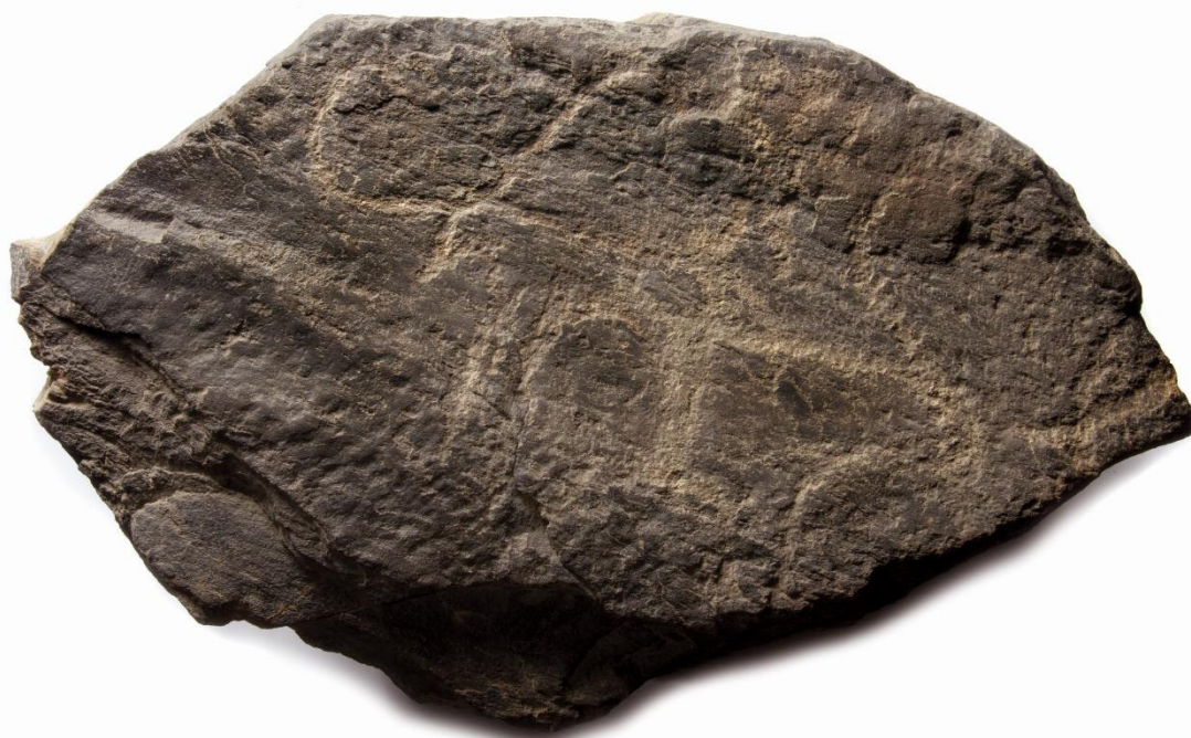
Głaz ze sztuką naskalną znajdujący się w Muzeum Archeologicznym w Poznaniu (fot. M. Jórdeczka).

Na prezentowanym poniżej głazie dostrzec można, choć zapewne nie od razu, trzy petroglify. Są to dwa przedstawienia bydła oraz wizerunek człowieka. Ponieważ rytzy są już dość silnie spatynowane, a zatem pokryte coraz bardziej ciemniejszą „skórką” (pustynnym werniszem), która powstaje przez tysiąclecia, można mieć dziś trudność w ich dostrzeżeniu, zwłaszcza jeśli oglądalibyśmy kamień w niesprzyjających warunkach oświetleniowych.