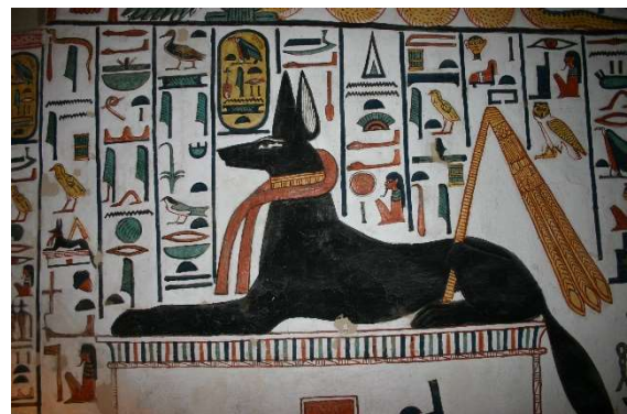
Anubis na kaplicy. Grobowiec Nefertari w Dolinie Królowych (XIX dynastia).

Opracowanie: Andrzej Ćwiek