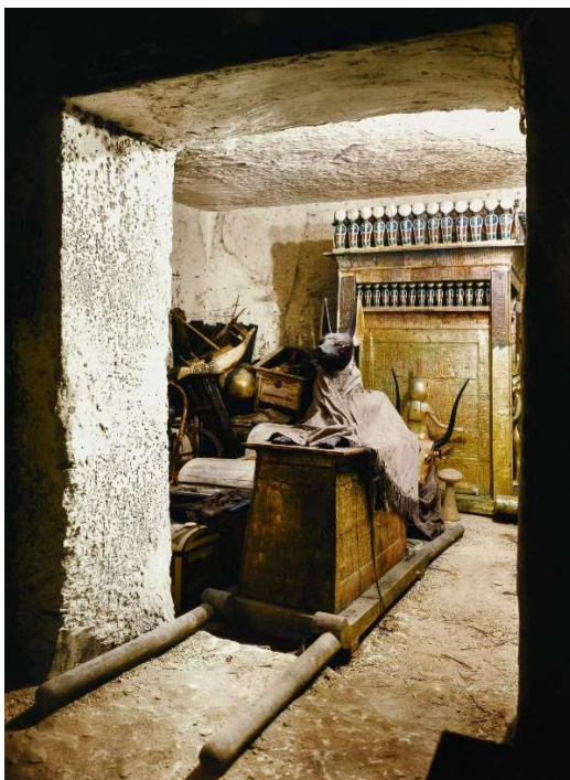
Anubis na skrzyni-kaplicy w grobowcu Tutanchamona w momencie odkrycia.

Nasza statuetka nie była tak bogato zdobiona jak ta z wyposażenia grobowego Tutanchamona, gdzie szakal miał pozłacane uszy, oprawę oczu, obrożę wokół szyi oraz pazury, a jego oczy wykonano z trawertynu i obsydianu. Był pokryty czarną lśniącą żywicą, a Anubis na wystawie w Poznaniu był tylko pomalowany na czarno grubą warstwą farby, która miejscami została mocno starta. Jego oczy nie są inkrustowane, lecz tęczęwki są namalowane. Nie zachował się ogon, który wykonany był z odrębnego kawałka drewna i umocowany prostopadle do tylnej części figury zwiisał wzdłuż skrzyni. Chociaż niewątpliwie nie jest to obiekt z królewskiego pochówku, jego jakość jest wysoka. Precyzyjne rzeźbienie pyska, oczu i uszu, nadające świętemu zwierzęciu dostojny wygląd wskazuje na warsztat zręcznego rzemieślnika. Posążek pochodzi prawdopodobnie z czasów XVIII dynastii, chociaż skrzynie-kaplice z Anubisem-szakalem występują również później, a podobne figury dekorowały skrzynki z naczyniami kanopskimi za czasów XX-XXI dynastii.